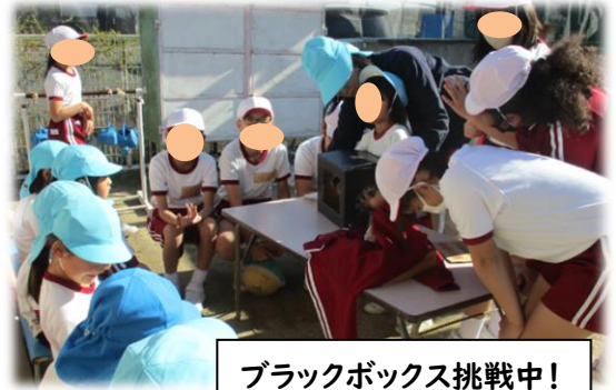
ブラックボックス挑戦中!

今回の交流のために5年生は園児が喜ぶ活動を計画してきました。がんばったね!5年生!