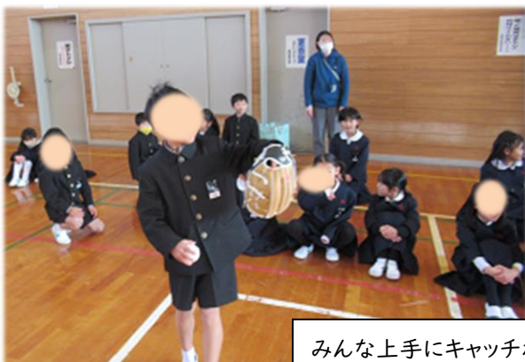
みんな上手にキャッチボール!