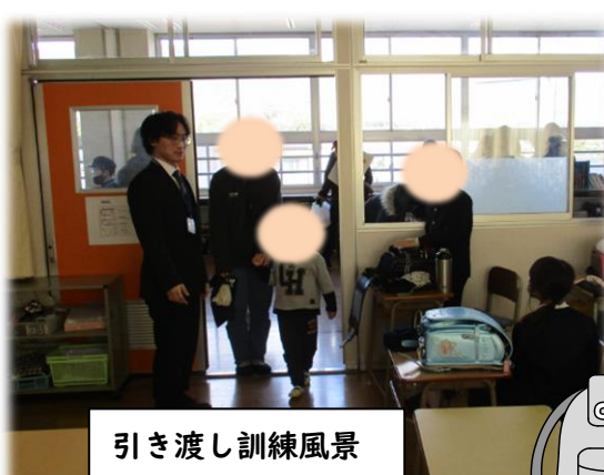
引き渡し訓練風景