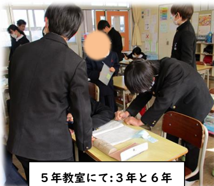
5年教室にて:3年と6年