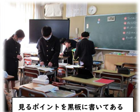
見るポイントを黒板に書いてある

R5.12 に行った学校評価アンケート(下表参照)から見ると、保護者は86%が肯定的な回答でした。一方で子どもたちは78%肯定的な回答でしたが、21%の子どもは否定的な回答でした。この21%の子ども達にやる気を出させたい。Azo ノート展覧会はやってみようと思う気持ちを育てる取り組みの一つです。さらに R6年度4月から表彰の枚数を以下のように変更し、(R5年度中は今まで通り) 中学年の表彰規定を下げます。 これもやる気につながってくれたらいいなと思います。