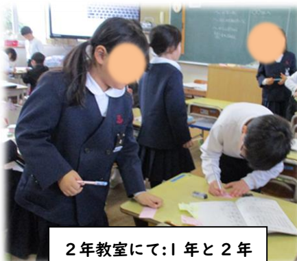
2年教室にて:1年と2年

意欲をもって Azo ノートに取り組むために新しいを始めました。その一つが「Azo ノート展覧会」です。これは、自分の取り組んできた Azo ノートの中で友だちに見て欲しいページを開き、他の子どもたちは付箋をもって見て回り、いいなと思ったところを書いて貼っていくという取り組みです。今までは自分の学年で行っていましたが、今回は他の学年へ行って、縦割り班が同じ人のノートをまず見ました。「字がきれいに書けています。」「絵があってわかりやすいです。」「計算が正しくてすごい。」などと書かれた付箋が Azo ノートに貼られていました。高学年は下学年へよりポイントを絞ったコメントが書かれていていいなと思いました。