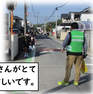
班長さんがとてもやさしいです。

かわいい1年生23名を迎え、阿曾小学校は令和5年度の活動を122名でスタートしました。毎日張り切って歩く1年生を気遣いながら、登校班の班長さんが歩くスピードに気をつけて登校してきます。安全に交通ルールを守って登下校してほしいと思います。お気づきのことがあれば、小学校へ遠慮なくご連絡ください。