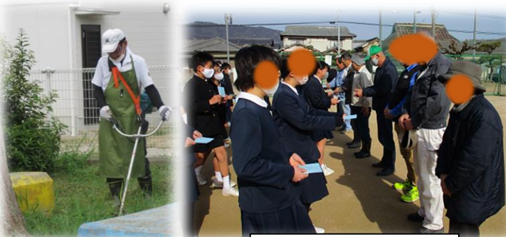
R4年度:お礼の手紙を6年生がわたしました。

※今年度も新規登録を随時受け付けておりますので、よろしくお願ひします。(阿曾小学校 担当:教頭まで 99-9100)