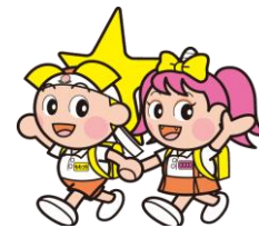
岡山県©「ももっち・うらっち」

子どもを犯罪から守り、明るく伸び伸びと育てるために、今後ともご協力をよろしくお願いいたします。