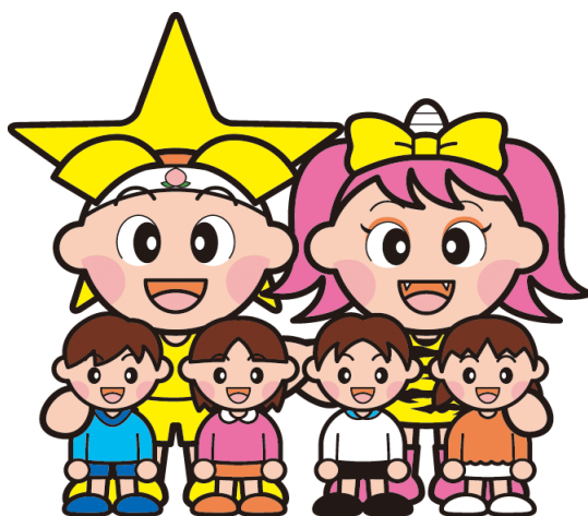
岡山県マスコット「ももっち」「うらっち」