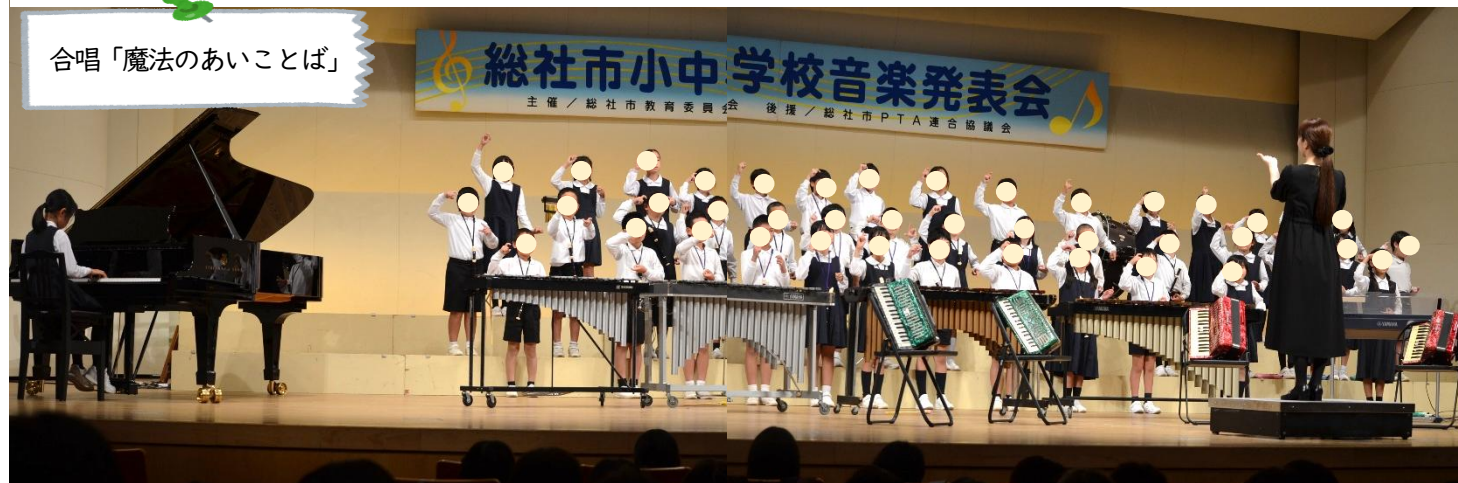
合唱「魔法のあいことば」

1学期から約4か月間、当日も直前まで一生懸命練習に取り組んできた阿曾っ子に大きな拍手を送ります。修学旅行に引き続き、こちらも全員が参加できたことをたいへんありがたく思っております。体調管理等子ども達を支え、送り出してくださった保護者の皆様に感謝申し上げます。